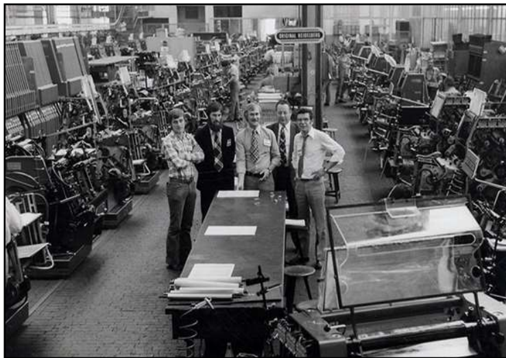
Bedrijfsbezoek van medewerkers van drukkerij Verstraete uit Ussel aan de fabriek in Heidelberg, 1974

TECHNISCHE VERBETERINGEN: In al die jaren ondergaat de drukpers een aantal technische aanpassingen. Het allereerste model is nog heel sterk geïnspireerd op