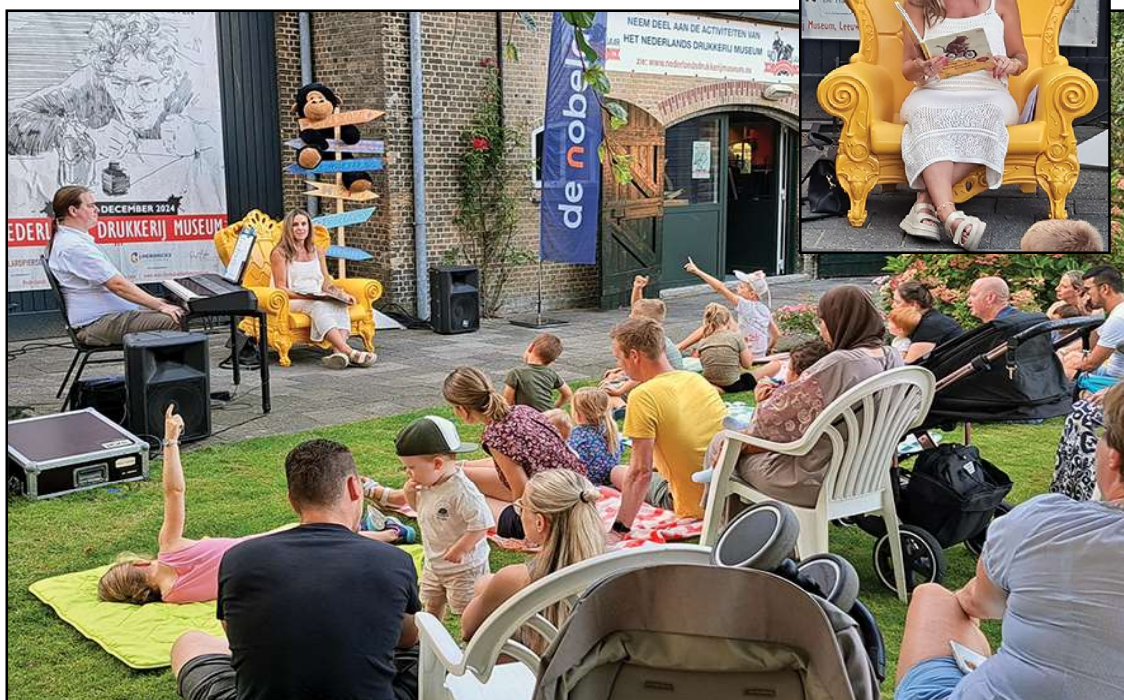
Er waren veel kinderen met hun ouders aanwezig op het grote grasveld voor het Nederlands Drukkerij Museum en ze luisterden aandachtig naar het verhaal.