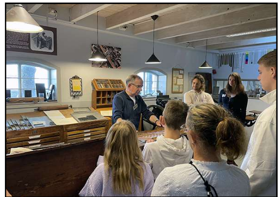
Foto boven: een grote banner was opgehangen tussen de bomen; foto onder links: gezellig bijeen aan een grote tafel en foto onder rechts: uitleg krijgen bij de rondleiding. Er waren burens bij, die nog nooit binnen waren geweest.