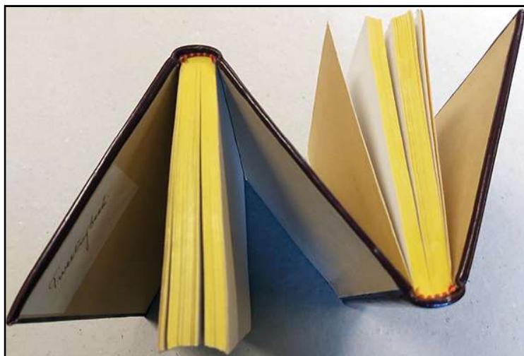
Detail van het „Tweelingboek” uit 1957 van boekbinder Frans Reijven.