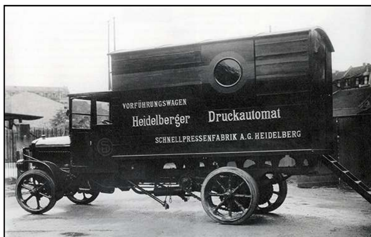
Vrachtwagen voorrijdende demonstraties, einde jaren 1920.