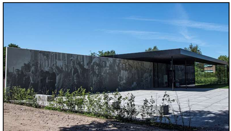
Het Maczek Memorial Breda aan de Ettensebaan 17A.